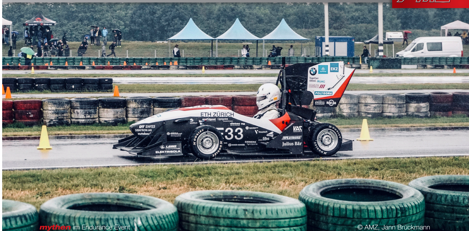
mythen im Endurance Event